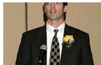
アメリカ人社長が日本人採用で用いる評価基準が興味深い