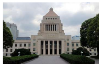
マイナンバー、中国で流出か＝長妻氏指摘、年金機構は否定