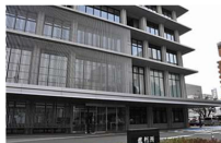
林真須美死刑囚が柴門ふみさん提訴 エッセーで「悪女」名誉毀損