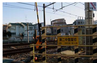
山手線唯一の踏切で人身事故発生 詳細をJR東日本に聞いた